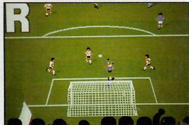
Screen shoots from Amiga version

The computer program, code, graphics and it's associated documentation and materials are protected by national and international copyright. Copying, translation, hiring, lending, broadcasting and public performance are prohibited without the written permission of MultiMedia.