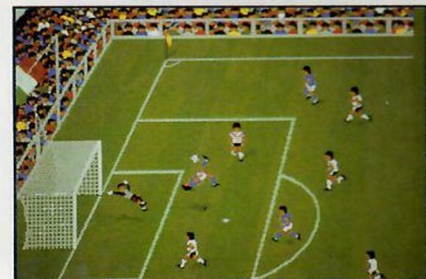
Schermate della versione Amiga

Il programma, grafica, codice e manualistica, sono soggetti a Copyright e quindi protetti dalle leggi nazionali ed internazionali. Il software non può essere duplicato, tradotto, modificato, immagazzinato su banche dati, trasmesso od utilizzato in esecuzione pubblica senza il permesso scritto della MultiMedia.